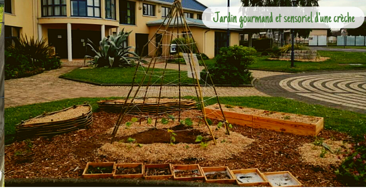
Jardin gourmand et sensoriel d'une crèche