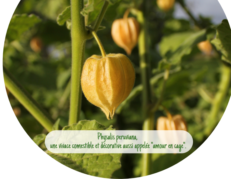
Physalis peruviana, une vivace comestible et décorative aussi appelée "amour en cage".