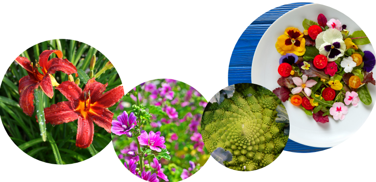
Hémérocalles, mauves de mauritanie, chou romanesco. Du beau et du bon, du jardin à l'assiette !