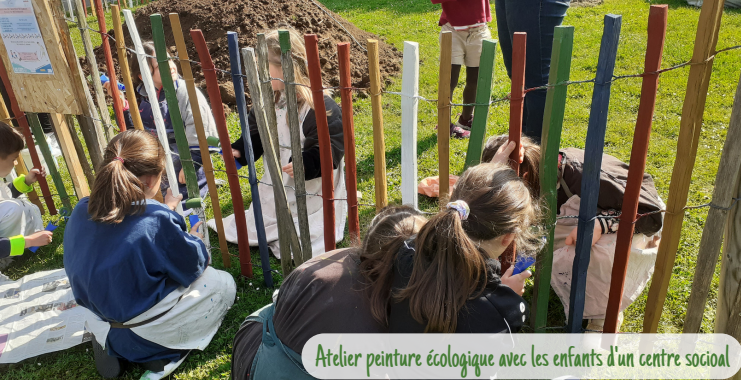
Atelier peinture écologique avec les enfants d'un centre social