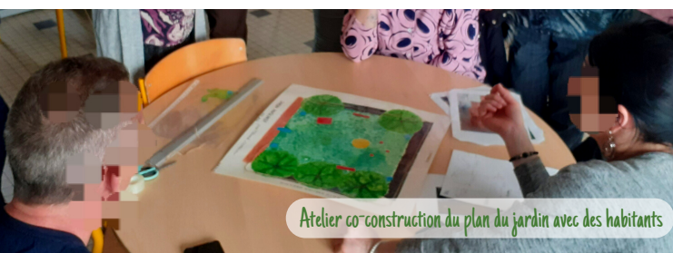
Atelier co-construction du plan du jardin avec des habitants