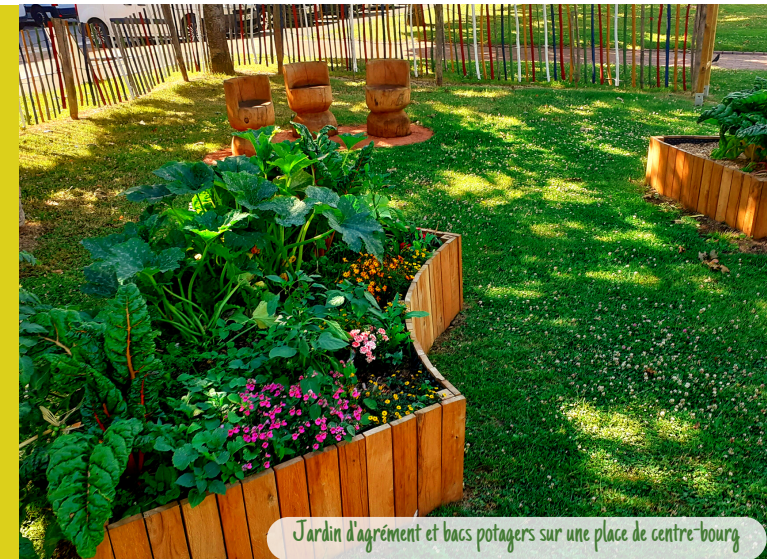
Jardin d'agrément et bacs potagers sur une place de centre-bourg